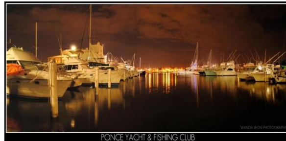
PONCE YACHT & FISHING CLUB